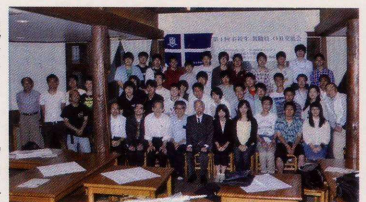
2015年度 在学生・教職員・OB交流会

動力機械工学科の学生・教職員のみなさんと卒業生との交流会を行います。大学生活をどのようにしたら、充実した生活を送れるかのヒントが見つかります。奮っての御参加をお待ちしております。軽食+ソフトドリンクを準備する都合などから、事務局メアド宛まで早めにお申し込み下さい!参加費は、学生500円/人です。